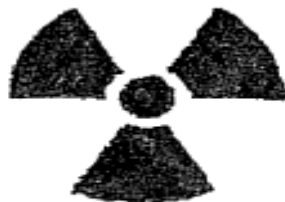
پسماند رادیو اکتیو